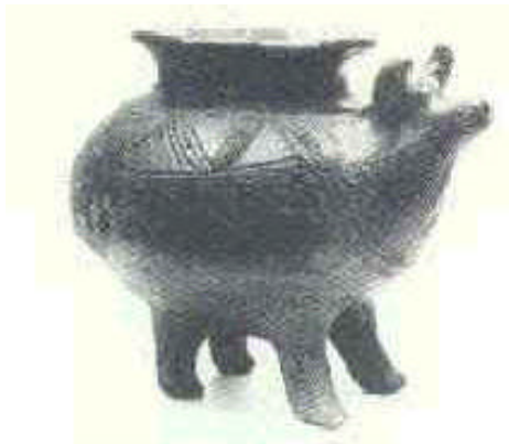
Fig. 6 - Vaso a forma di bovide: il muso funge da becco di versamento; gli occhi sono costituiti da cerchietti d'osso. Decorazione geometrica "a cordicella". Aste, necropoli Casa di ricovero, tomba 131. Seconda metà VIII sec. a.C. Alt cm 44,5

L'alfabeto in uso presso i veneti antichi deriva, con alcune modificazioni, dall'alfabeto etrusco. La scrittura secondo il principio alfabetico (cioè un segno per un suono) era stata elaborata dai fenici sulla base di scritture già in uso nel Mediterraneo orientale. I fenici prima dell'VIII sec. a.C. l'avevano trasmessa ai Greci. A loro volta i Greci l'avevano trasmessa ai Romani e questi ai Veneti.