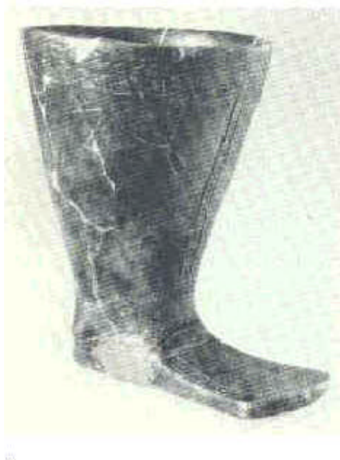
Fig. 2 - Vaso a forma di stivale ad alto gambale decorato con incisioni riproducenti le cuciture e l'allacciatura anteriore; sotto l'orlo figure di cavallini. Alt. cm 17.